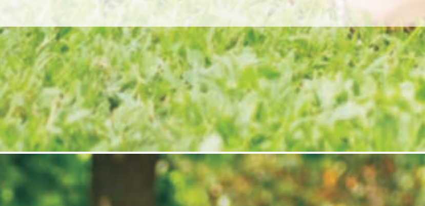
▲ 西班牙马德里康普莱斯大学 ▲ 瑞典林奈大学

同时,对于有意报读国际班但在高考录取时未能被国际班录取的我校各专业新生,入校后,经自愿申请,可按学校规定程序,选拔进入金融(国际班)、会计(国际班)专业学习。被选拔进入国际班学习的学生,如果是金融学、会计学专业的,将通过转系(院)程序进入金融(国际班)、会计(国际班)专业学习;如果是非金融、会计等专业的,将通过转专业程序转入金融(国际班)、会计(国际班)专业学习。